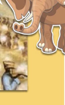
Batalla de Pichincha. Quito Informa. https://www.quitoinforma.gob.ec/2022/05/24/batalla-de-pichincha-el-sello-de-la-libertad/

¿Podrías nombrar los dos bandos que pelearon en esta batalla?