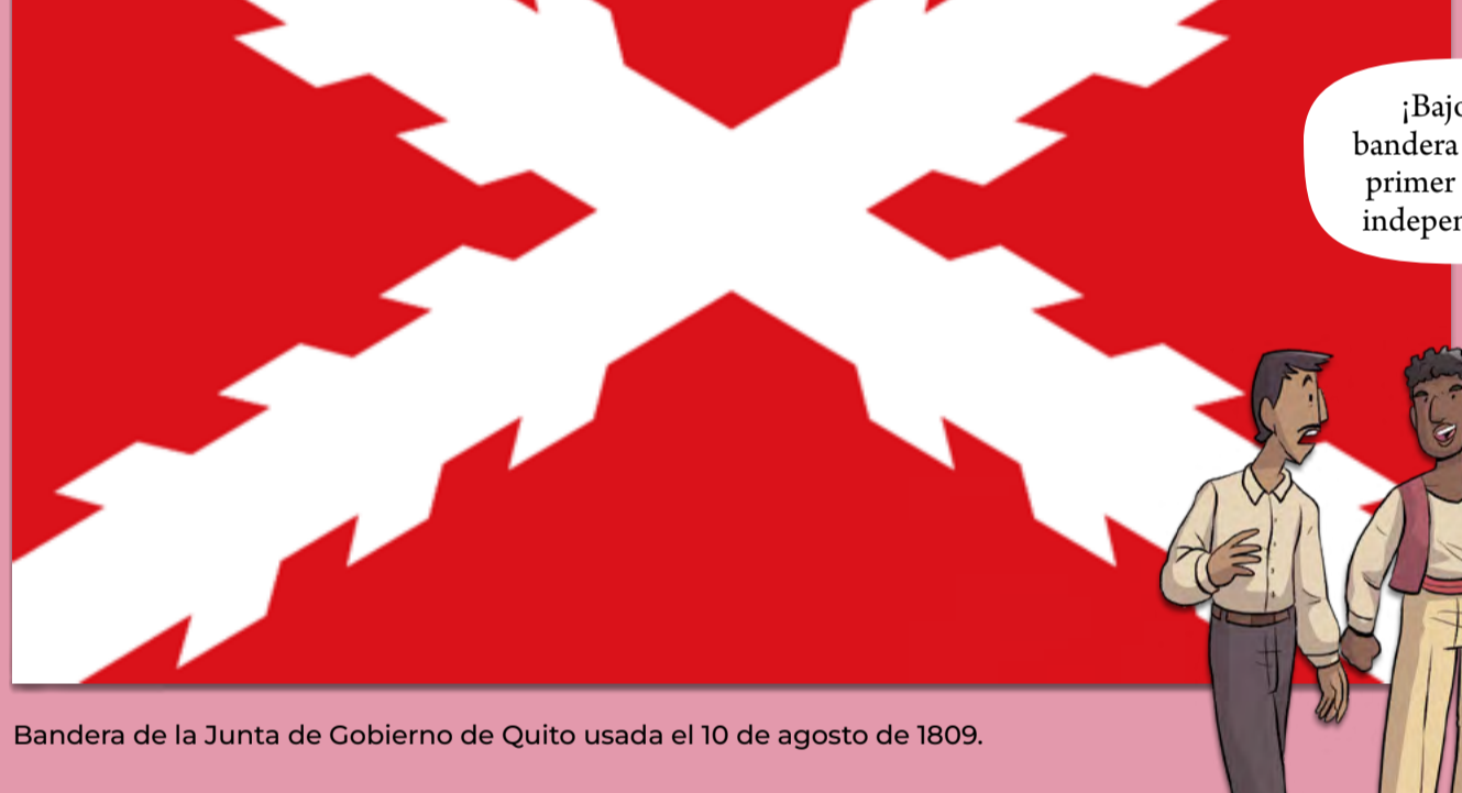
Bandera de la Junta de Gobierno de Quito usada el 10 de agosto de 1809.

¡Bajo esta bandera dimos el primer grito de independencia!