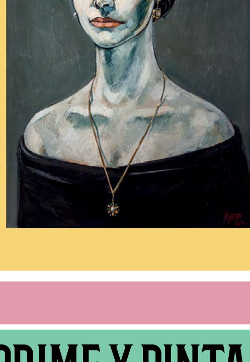
Retrato de Manuela Sáenz, Oswaldo Viteri (1931-2023) óleo sobre tela, 86,5 x 62 cm, Presidencia de la República del Ecuador.