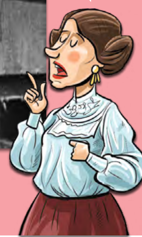
Alfaro y el tren transandino.

La primera locomotora llegó a Quito en 1908. ¿Reconoces a Eloy Alfaro?